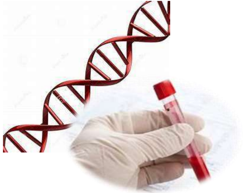
Test Prenatal no invasivo