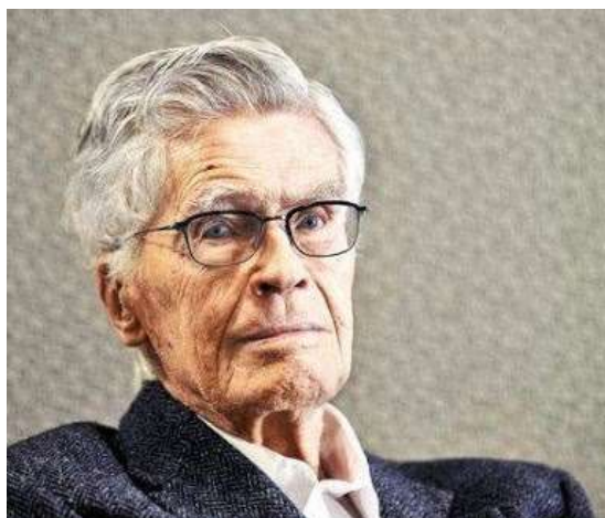
Mario Bunge (1919-2020)